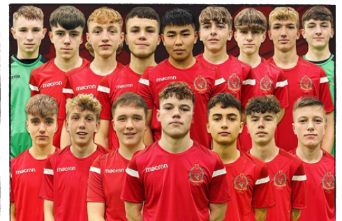
Diwrnod y Gêm (21/11/22) UDA 0 - 3 CBM Cymru

Gartref yng Nghymru, aeth 44 o glybiau sy'n aelodau ati i gynnal partïon gwylïo a gweithgareddau yn ymwneud â phêl-droed, gan sicrhau etifeddiaeth pêl-droed Cymru mewn clybiau sy'n cwmpasu 3631 o bobl ifanc.