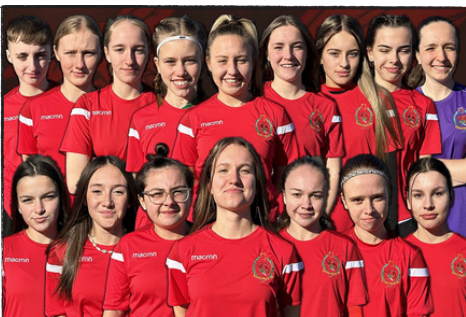
Diwrnod y Gêm (21/11/22) UDA 2 - 0 CBM Cymru

Dyfarfwyd cyllid i ni gan Lywodraeth Cymru a threfnom daith i fynd â 32 o bobl ifanc, pob un ohonynt dan 15 oed, a staff cymorth i Boston yn America , i chwarae gemau yn erbyn timau cynrychioliadol o America ar y diwrnod y chwaraeodd Tîm Cenedlaethol Dynion Cymru yn erbyn Tîm UDA yng Nghwpan y Byd yn Qatar. Pwrpas y daith hon oedd darparu cyfle a allai drawsnewid bywydau pobl ifanc o Gymru ac iddynt brofi eu sgiliau mewn gwlad arall.